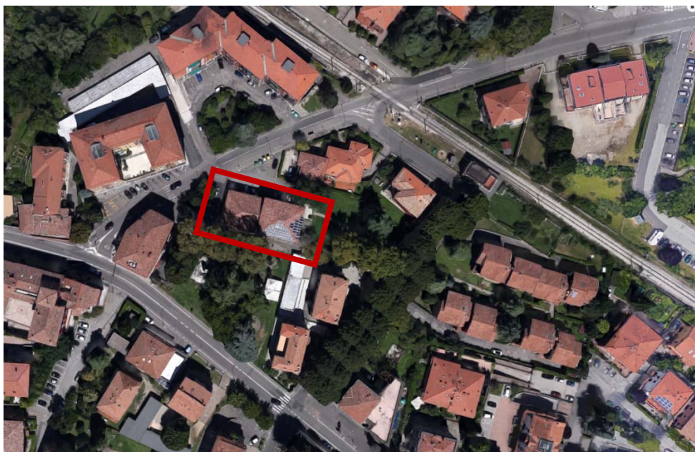
Ubicazione dell'edificio oggetto di intervento

L'edificio, oggi adibito a Biblioteca Comunale, è composto da due corpi di fabbrica aderenti, realizzati in epoche differenti, uno di matrice ottocentesca e uno più recente di epoca fascista.