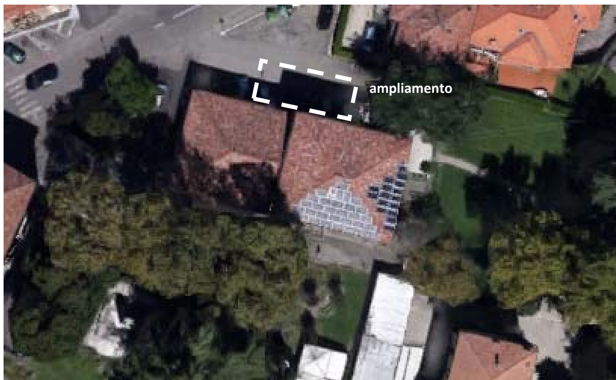
Individuazione area dell'intervento di ampliamento