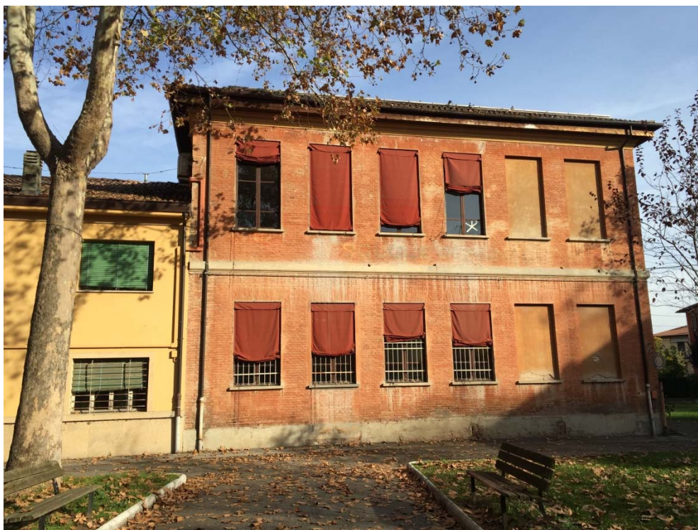
Foto dello stato attuale